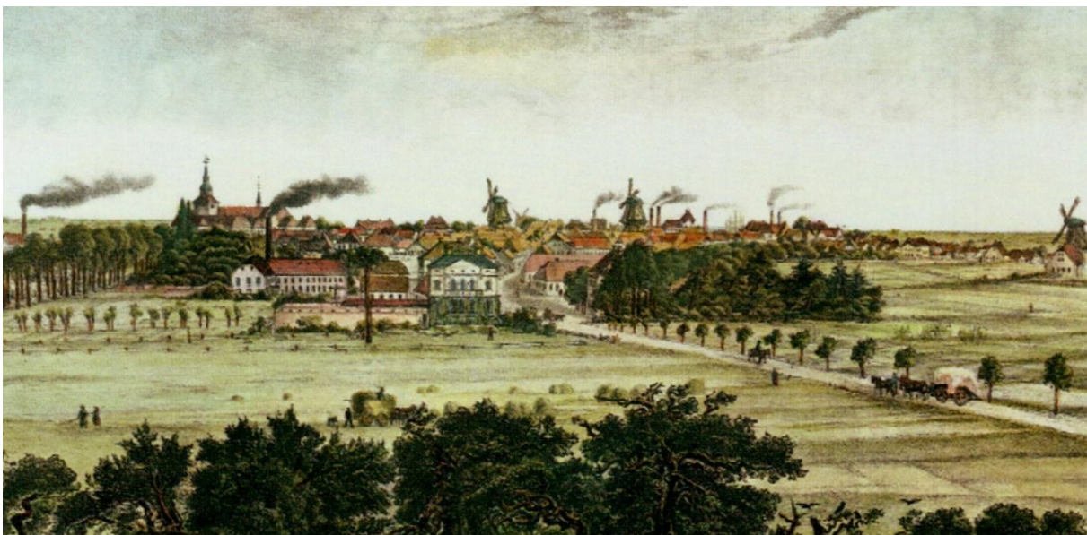
Die Schornsteine rauchen noch: Varel um 1855, von Südwesten aus gesehen

Aber diese Vorstöße scheiterten wegen der absehbaren Kosten am Widerstand zu vieler Bürger. Gewiss spielte auch eine Rolle, dass die Weltwirtschaftskrise 1857 Varel besonders hart traf. Varel verlor dauerhaft seinen wichtigsten Wettbewerbsvorteil, grob vereinfacht: den Export von Getreide und Vieh über den Vareler Hafen bei gleichzeitigem Import von Rohstoffen und Halbfabrikaten, die dann vor Ort weiterverarbeitet wurden: Die Schiffe wurden